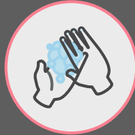
ล้างมือเป็นประจำ