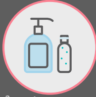
ใช้เจลทำความสะอาด