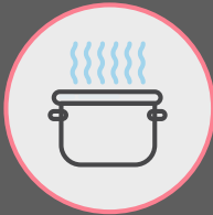
ทานอาหารขณะร้อน