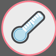
ตรวจวัดอุณหภูมิ