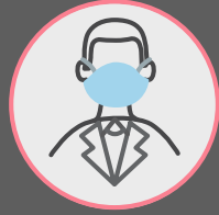
สวมหน้ากากอนามัยเสมอ